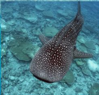
Whale Shark Snorkeling