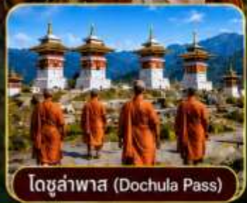
โดจุลาพาส (Dochula Pass)