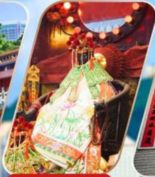
KWAN YUM HH