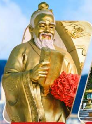
WONG TAI SIN