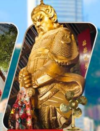
CHE KUNG (SHA TIN)