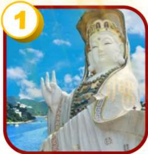
รีพัลส์เบย์