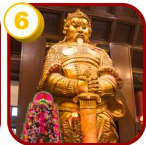
วัดแชกง (ซ่าถิ้น)