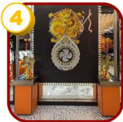
ศูนย์ฮวงจุ้ยกังหัน