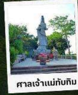
ศาลเจ้าแม่ทับทิม