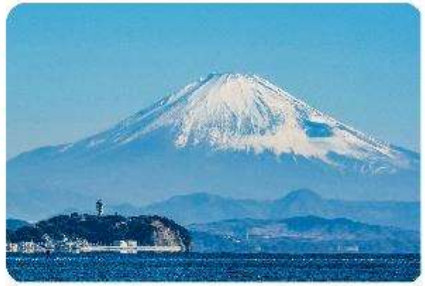
เกาะเอโนะชิมะ

เมืองคามาคุระ (Kamakura) เมืองน่ารักติดทะเล ตอบโจทย์ที่เที่ยวที่ผสมผสานระหว่างประวัติศาสตร์ ธรรมชาติ และความงามของทะเล บอกเลยใครมาต้องตกหลุมรักกับเมืองสุดชิล อย่าง คามาคุระ เมืองเล็กๆ ที่ตั้งอยู่ทางตอนใต้ของจังหวัดคานากาวะ ห่างจากโตเกียวเพียงแค่ 1 ชั่วโมง เท่านั้น แต่เต็มไปด้วยสถานที่ท่องเที่ยว ทิวทัศน์ธรรมชาติ และชายหาดที่งดงาม ที่นี้จะทำให้ทุกคนรู้สึกเหมือนได้ย้อนกลับไปสัมผัสประวัติศาสตร์ญี่ปุ่นในยุคซามูไร พร้อมทั้งได้ผ่อนคลายท่ามกลางบรรยากาศที่เงียบสงบและสดชื่น