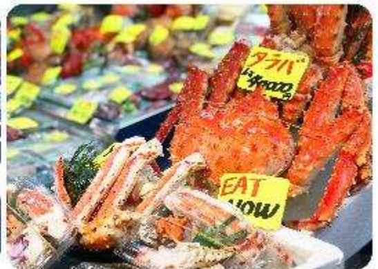
ตลาดปลาซึกิจิ

แนะนำที่เกี่ยว อิสระด้วยตัวเอง - ตลาดปลาซึกิจิ Tsukiji Outer Market ตลาดปลาชื่อมีชื่อเสียงของญี่ปุ่น และยังเป็นหนึ่งในตลาดปลาที่ใหญ่ที่สุดในโลกด้วยค่ะ ตั้งอยู่ในโตเกียว ตลาดแห่งนี้มีการซื้อขายอาหารทะเลมากกว่า 2,000 ตันต่อวัน โดยโซนภายในตลาดนั้นจะแบ่งออกเป็น 2 ส่วน ก็คือ ส่วนด้านนอก ที่มีร้านค้าปลีกและร้านอาหารอยู่เรียงรายให้เราได้เลือกซื้ออาหารทะเลสดๆ รับประทานกัน