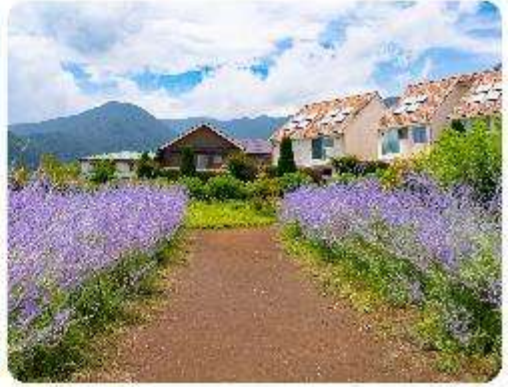
สวนโออิชิ ปาร์ค

สวนดอกไม้โออิชิ พาร์ค (Oishi Park) มหัศจรรย์แห่งวิวกุเขาไฟฟูจิ หนึ่งในจุดชมวิวกองกุเขาไฟฟูจิที่สวยงามที่สุดอีกจุดหนึ่ง ที่จะเติมเต็มความสงบและความงดงามของธรรมชาติในญี่ปุ่นเมื่อไปเยือน คือสถานที่ที่ไม่ควรพลาด สวนดอกไม้โออิชิ พาร์ค (Oishi Park) แห่งนี้ไม่ได้เป็นเพียงสถานที่ที่มีดอกไม้สวยงามให้เราได้ชื่นชมแล้ว จุดเด่นของสวนนี้คือวิวกุเขาฟูจิที่อยู่เบื้องหลังสวนดอกไม้สีสันสดใส ที่บานสะพรั่งในทุกฤดูกาล และยังเป็นมุมที่ทำให้เราได้สัมผัสกับวิวกุเขาฟูจิได้อย่างใกล้ชิด จากนั้นนำพาทุกท่านสู่..